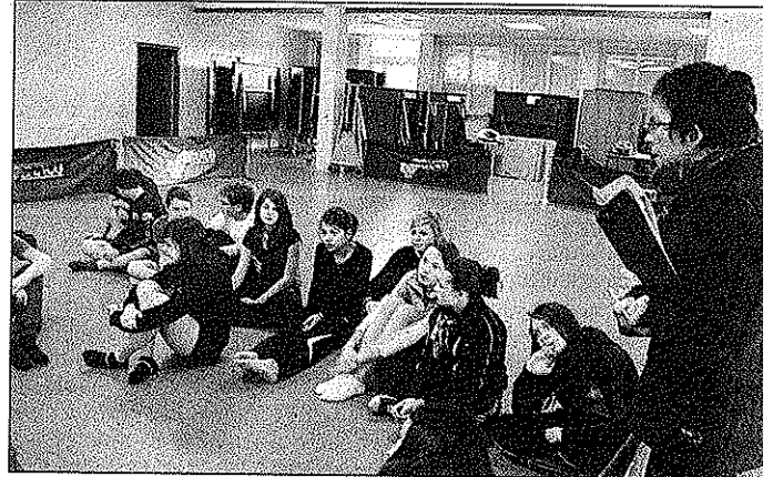
Discussion, concertation, échanges font partie du projet.

Au cours de l'année scolaire, deux classes du collège Camille-Flammarion, les 6 e 1 et les 4 e 1, bénéficient d'un PAG (projet artistique globalisé) autour de la danse.